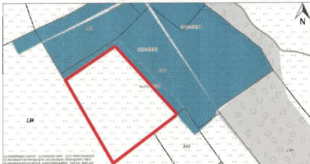
Abbildung 1 Übersicht Ausgleichsfläche Flurstück Nr. 166, Teilfläche

Folgende umweltbezogene Informationen und Stellungnahmen zu folgenden Schutzgütern sind verfügbar: